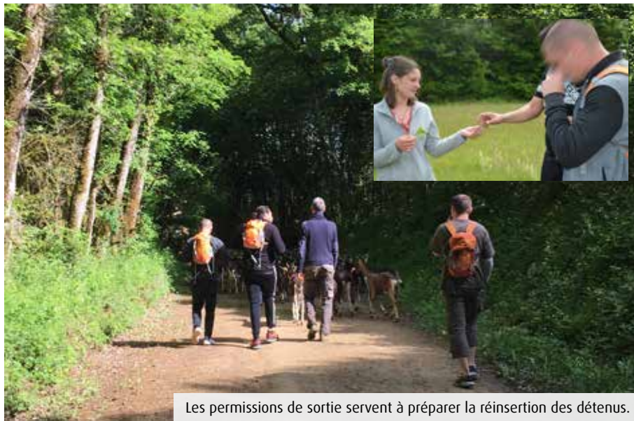
Les permissions de sortie servent à préparer la réinsertion des détenus.

Rendez-vous chez Thomas. Depuis trois ans, ce maraîcher fait pousser une soixantaine de légumes différents et 250 arbres, sur un grand terrain situé juste