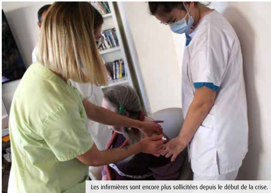
Les infirmières sont encore plus sollicitées depuis le début de la crise.

D'un côté, des infirmières lasses de leurs conditions de travail, de l'autre la première filière de formation demandée sur Parcours Sup. Derrière ce paradoxe apparent se cache une réalité très humaine.