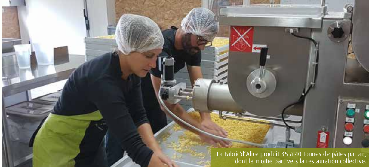
La Fabric'd'Alice produit 35 à 40 tonnes de pâtes par an, dont la moitié part vers la restauration collective.