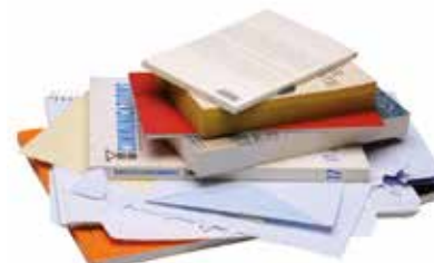
Tous les autres papiers.