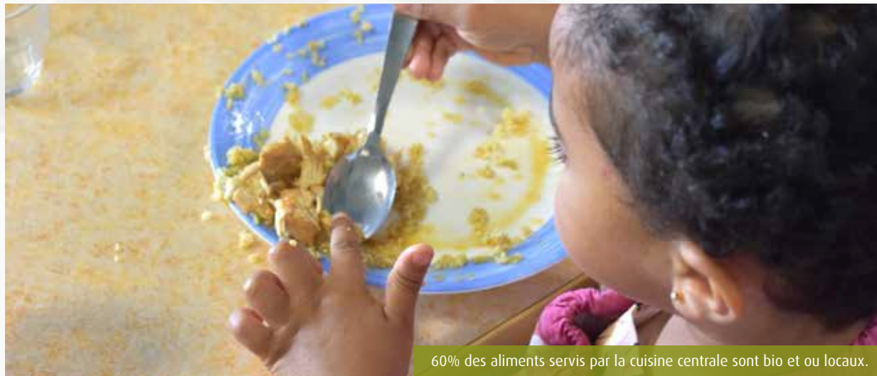
60% des aliments servis par la cuisine centrale sont bio et ou locaux.

La rédaction du « Pat » est en cours... Comprenez le Projet alimentaire territorial. Selon le ministère de l'Agriculture, ce dispositif a pour objectif de « relocaliser l'agriculture et l'alimentation dans les territoires en soutenant l'installation d'agriculteurs, les circuits courts ou les produits locaux dans les cantines ». Ici, la mise en place du Pat concerne non seulement Grand Poitiers mais aussi les communautés de communes du Haut-Poitou et de la Vallée du Clain. Des propositions ont déjà été formulées par des producteurs locaux, des transformateurs, des distributeurs, des collectivités, des associations... En tant que consommateurs, vous pouvez aussi donner votre avis sur la plateforme jeparticipe-grandpoitiers.fr . Et pourquoi pas demain imaginer un atelier de transformation locale, une légumerie mutualisée ou encore des cours d'éducation alimentaire pour les enfants ? Tout est possible.