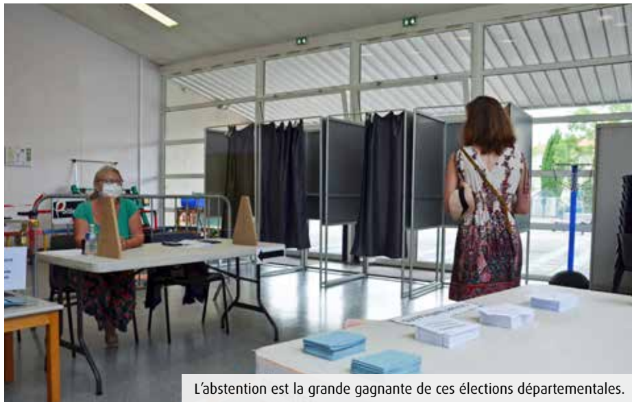
L'abstention est la grande gagnante de ces élections départementales.