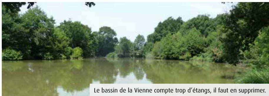
Le bassin de la Vienne compte trop d'étangs, il faut en supprimer.