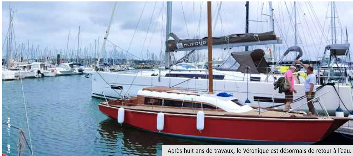
Après huit ans de travaux, le Véronique est désormais de retour à l'eau.

On peut habiter la Vienne et être passionné de voile. La preuve, une dizaine d'administrateurs et salariés du chantier d'insertion Cap Vert, à Buxerolles, ont retapé un voilier de 8,60m. Mis à l'eau mercredi dernier à La Rochelle, ce bateau aura une vocation pédagogique.