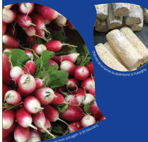
Radis de chez «Les Légumes de mon potager» à St-Sauvant. Cheeses de la Ferme du Bois-Rond à Pussigny

CHEZ BIOCOOP LES PRODUITS LOCAUX SONT PARTOUT