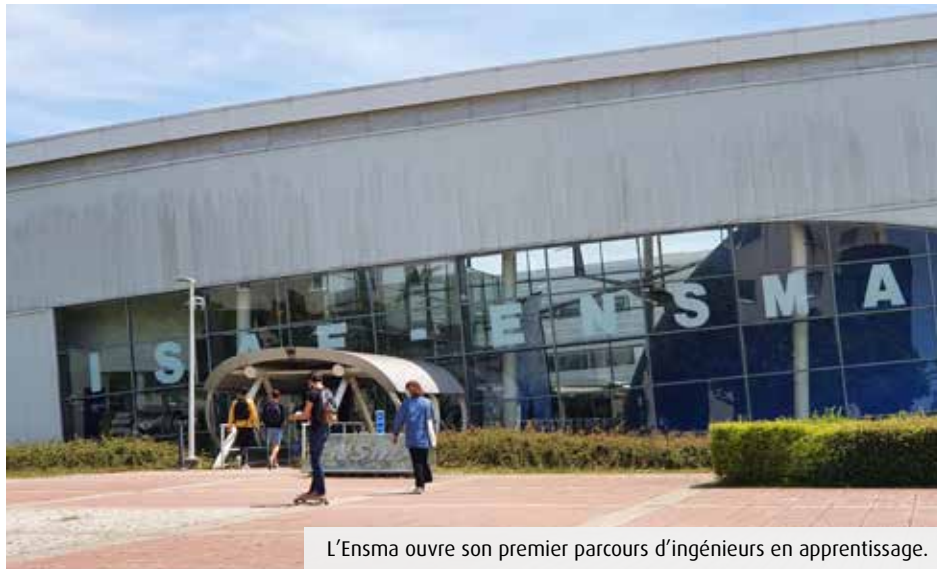
L'Ensmat ouvre son premier parcours d'ingénieurs en apprentissage.

Le recrutement a commencé. 55 places ont été ouvertes dont 25 à l'Ensmat. Il y en aura 115 lorsque les quatre écoles du groupe intégreront réellement le parcours. Un bac+2 minimum et de solides bases en mathématiques sont requis. 300 candidats ont passé les tests d'évaluation (QCM) début avril,