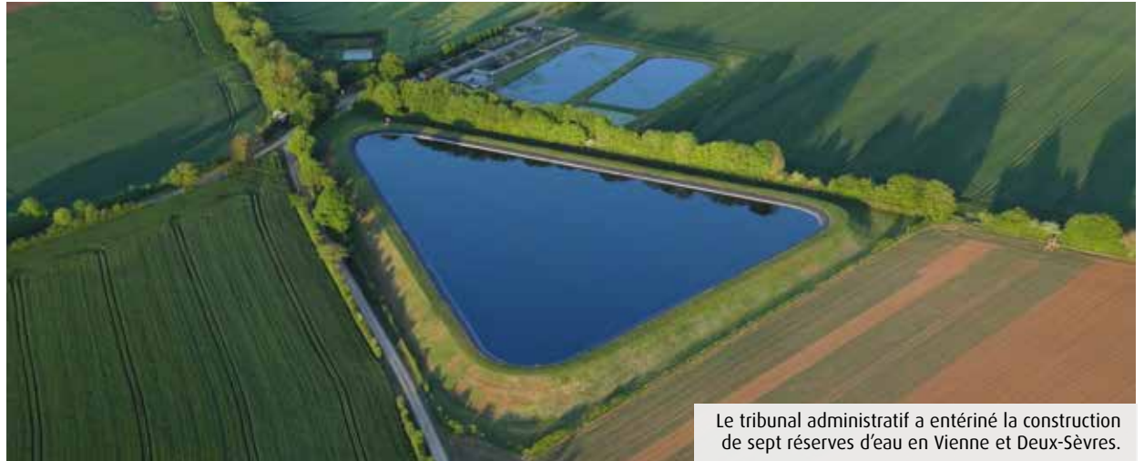
Le tribunal administratif a entériné la construction de sept réserves d'eau en Vienne et Deux-Sèvres.

Le CPIE du Seuil du Poitou organise jeudi, de 10h à 12h, une balade dans les Bois de Saint-Pierre, à Smarves, pour découvrir les richesses de la biodiversité forestière (gratuit). Le lieu de rendez-vous sera donné sur le billet à télécharger sur la confirmation d'inscription. Rendez-vous sur helloasso.com.