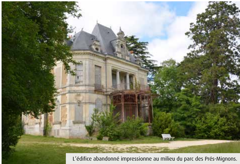
L'édifice abandonné impressionne au milieu du parc des Prés-Mignons.

Après des dizaines d'années de fastes et d'allégresse, cette demeure bourgeoise est devenue une véritable « verrue » au milieu du parc des Prés-Mignons. A tel point qu'en 2014, à l'occasion des élections municipales, le comité de quartier publiait dans son journal Vivre à Poitiers-Sud une lettre ouverte aux candidats. En Une, la photo de la villa barrée du titre « Quel avenir ? » et d'une citation de Jean-Jacques Rousseau : « Si l'on ne détruit pas une « ruine », c'est qu'elle peut encore être utile. » Malheureusement pour ses auteurs, cette missive n'a reçu aucune réponse constructive. La Ville de Poitiers a racheté le bâtiment et le terrain en 1984, pour garder la main sur l'avenir des lieux mais sans réel projet. Ensuite, les nombreuses tentatives menées par les riverains depuis près de quarante ans pour attirer le regard des municipalités successives sont toujours restées vaines. « On a même organisé la dernière fête de quartier juste devant pour la montrer à la nouvelle maire Léonore Moncond'huy et à son