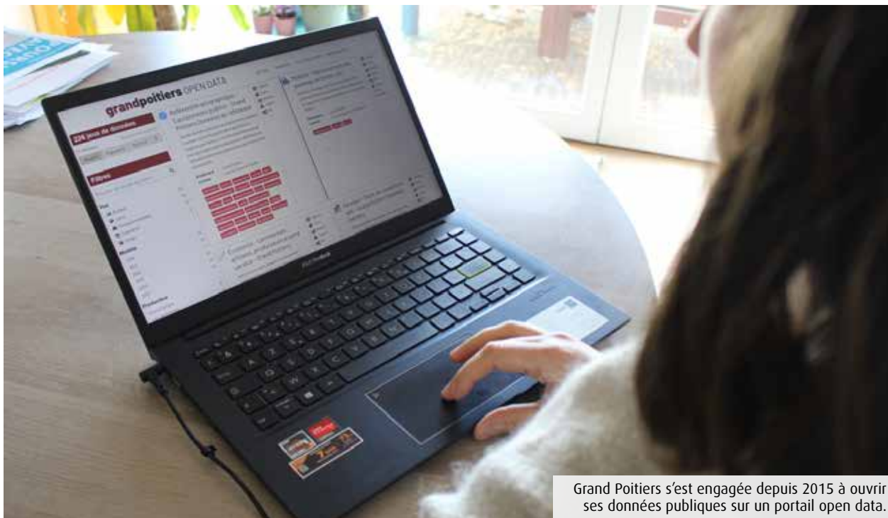
Grand Poitiers s'est engagée depuis 2015 à ouvrir ses données publiques sur un portail open data.

Troisième et dernier volet de notre dossier consacré à la convention citoyenne sur le numérique responsable, portée par la Ville de Poitiers et dont Le 7 est partenaire. Invitée à la table ronde de jeudi (1) sur le big data, l'ex-présidente d'Open Data France Laurence Comparat explique pourquoi l'ouverture des données publiques est un enjeu majeur.