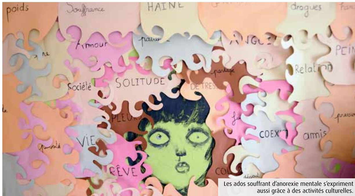
Les ados souffrant d'anorexie mentale s'expriment aussi grâce à des activités culturelles.

La Journée mondiale des Troubles des conduites alimentaires (TCA) se déroule le 2 juin. En France, sur les 900 000 personnes atteintes d'anorexie mentale, d'hyperphagie boulimique ou de boulimie, la moitié n'accède pas à des soins. Au centre hospitalier Laborit de Poitiers, la prise en charge est pourtant pointue.