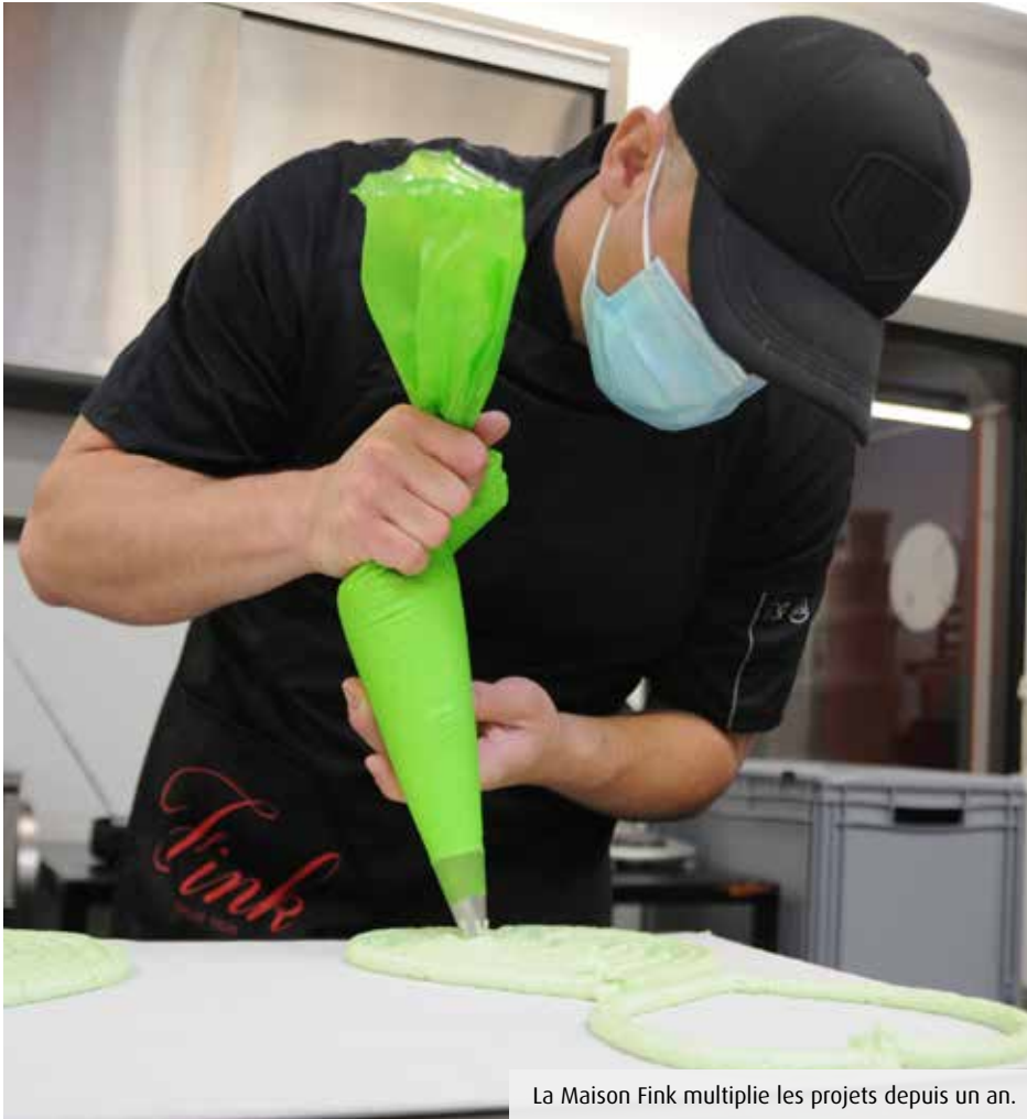
La Maison Fink multiplie les projets depuis un an.

En six mois, le chocolatier Fink (18 salariés) a érigé un laboratoire flambant neuf à Poitiers-Sud et doublé sa surface de vente en centre-ville. Une foi en l'avenir impressionnante pour une vieille dame presque bicentenaire.