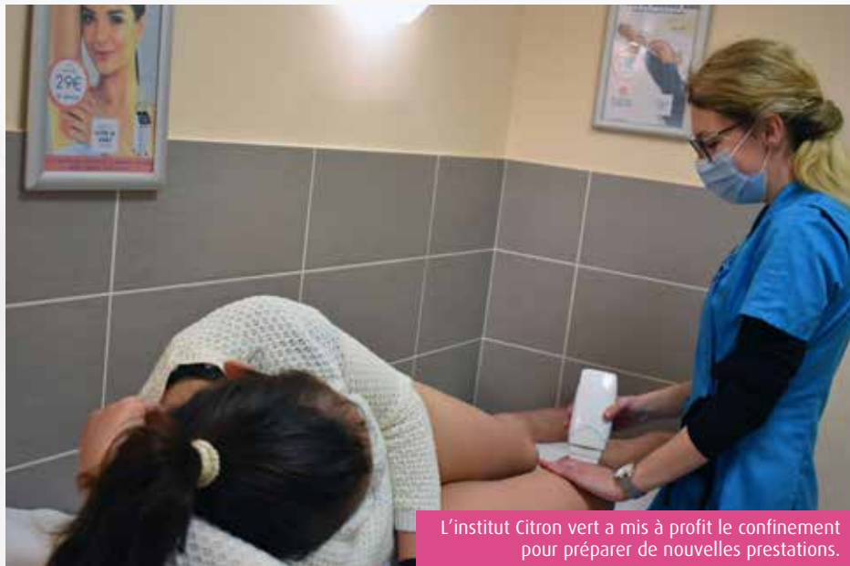
L'institut Citron vert a mis à profit le confinement pour préparer de nouvelles prestations.

Ici aussi, le redémarrage de l'activité a été plus que soutenu même si « pendant le confinement, quelques clientes ont pris l'habitude de faire certains soins elles-mêmes », déplore l'esthéticienne, qui constate