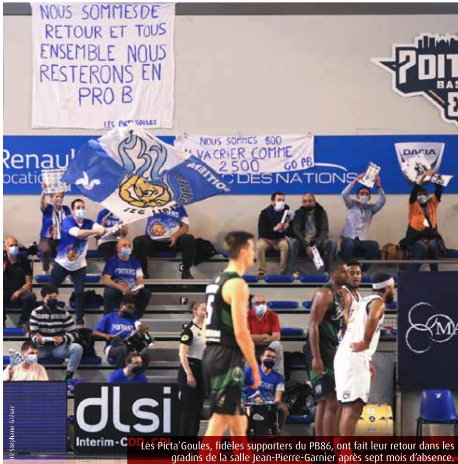
Les Picta'Goules, fidèles supporters du PB86, ont fait leur retour dans les gradins de la salle Jean-Pierre-Garnier après sept mois d'absence.

Les Picta'Goules ont retrouvé les gradins de la salle Jean-Pierre-Garnier. Leur soutien pourrait s'avérer précieux cette semaine, avec trois matchs à la maison pour entretenir l'espoir d'un maintien en Pro B.