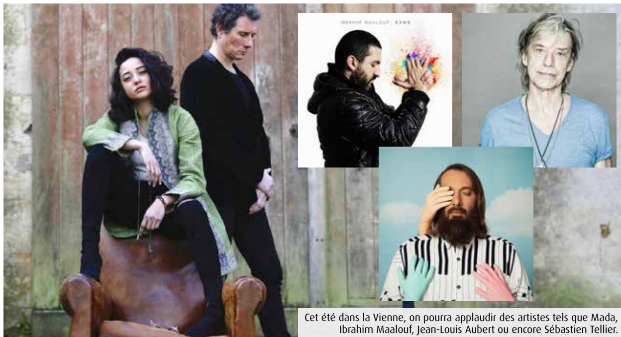
Cet été dans la Vienne, on pourra applaudir des artistes tels que Mada, Ibrahim Maalouf, Jean-Louis Aubert ou encore Sébastien Tellier.

De nouveau ouverte au public depuis le 19 mai, l'abbaye de Saint-Savin-sur-Gartempe accueille actuellement une partie de l'exposition régionale « GR 2021 - Penser un nouveau monde ? ». Né de la collaboration entre Abbatia, le réseau des abbayes de Nouvelle-Aquitaine, et le Fonds régional d'Art contemporain Poitou-Charentes, cet événement propose un circuit de visites inédit entre sept monuments historiques de la Région - parmi lesquels l'abbaye de Saint-Savin - accueillant en leurs murs 90 œuvres d'art contemporain fortement inspirées par les valeurs de l'Unesco. Ouverte à tous les publics jusqu'au 23 juin, cette exposition répond avec force à un besoin actuel d'évasion, de culture, et de beauté.